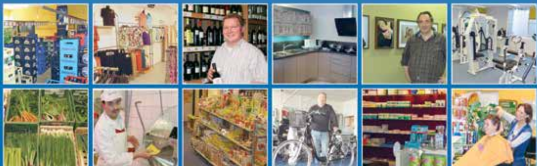
Änderungen vorbehalten Stand 04/2014